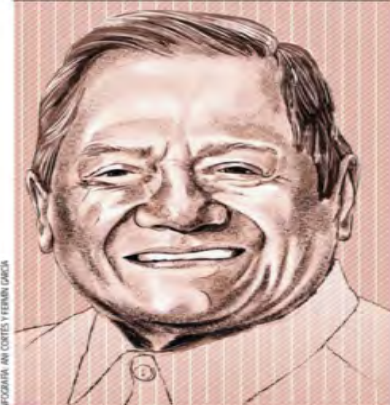
INFORMACIÓN AN CORDES Y FERRARI CÁDIZ