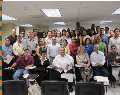
Sesión de capacitación en Tamaulipas