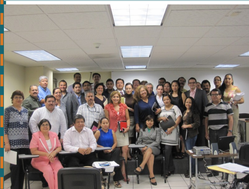
Sesión de capacitación en Tamaulipas