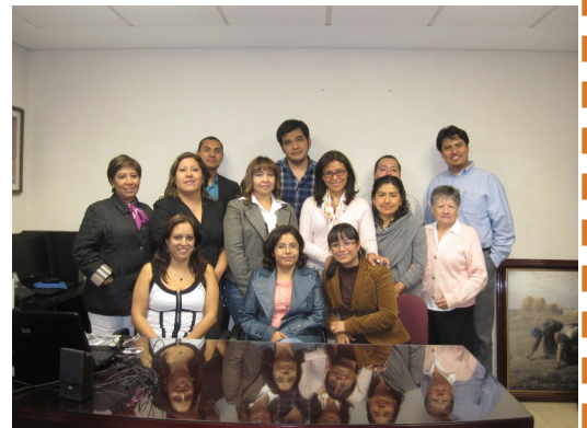
Sesión de capacitación Comisión Substanciadora Única del Poder Judicial de la Federación