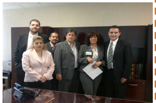
Sesión de capacitación Comisión Substanciadora Única del Poder Judicial de la Federación