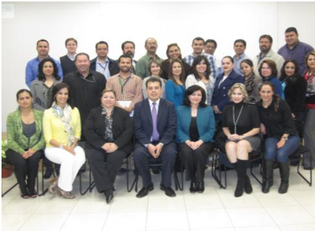
Instituto de la Judicatura Federal, Casa de la Cultura en Tijuana

De igual forma agradecemos a la Coordinación en la Casa de la Cultura de Tijuana, por la colaboración brindada.