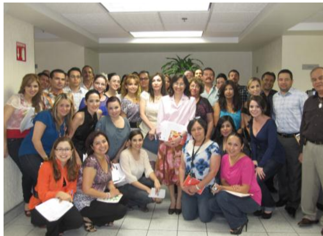
Instituto de la Judicatura Federal, extensión Mexicali